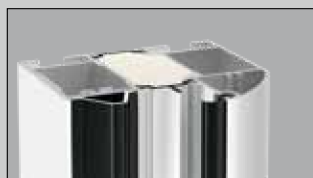
Roundstyle (Profilo A3)